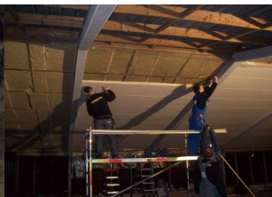
De daken worden bekleed