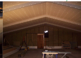
8500 gaatjes te vullen