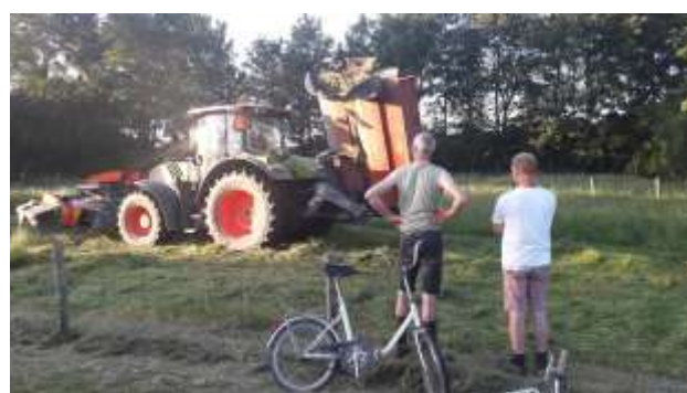
burenhulp is goud waard!