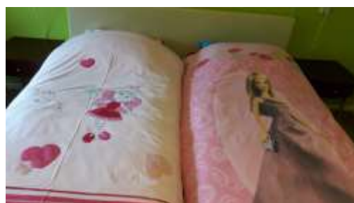
meisjes te logeren 😊 😊