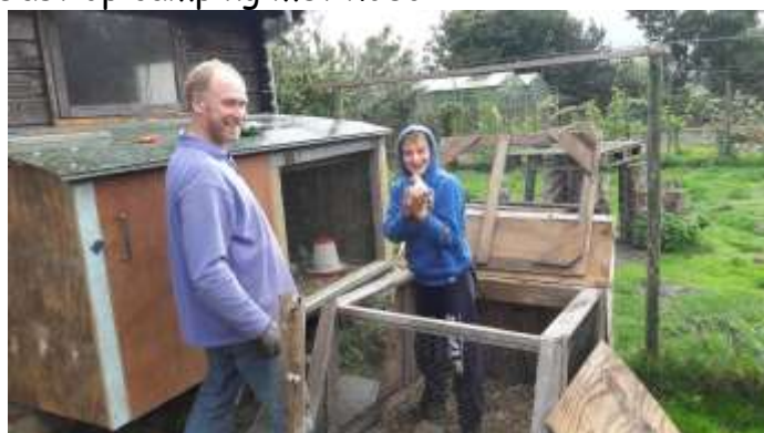
Toen kuikens nu grote hanen van 1 jaar