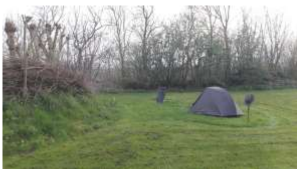
Gast op camping met hoed