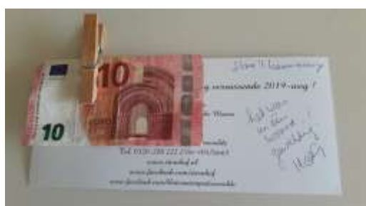
fooi blijte gasten